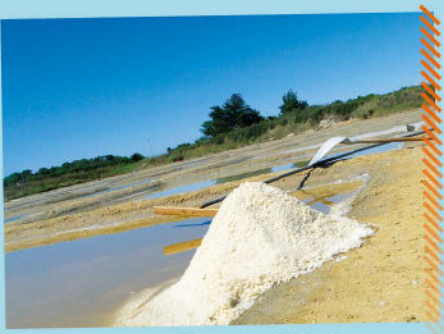
Le Port des Salines