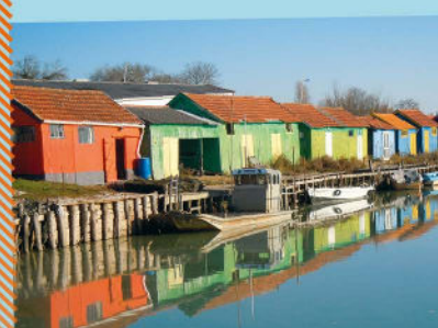
Cabanes ostréicoles du Château d'Oléron