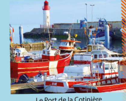
Le Port de la Cotinière